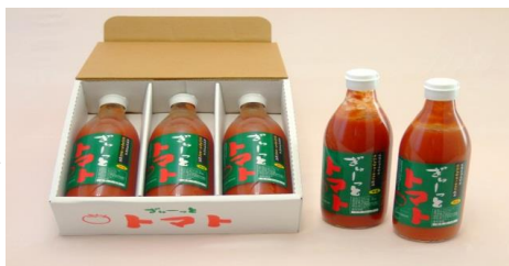
(500ml × 3本セット)