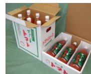
(1000ml × 6本・3本セット)